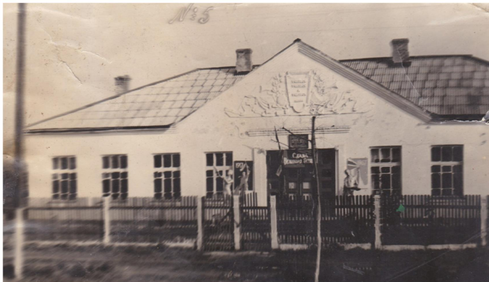
1961 год. Начальная школа № 5 реорганизована в восьмилетнюю школу